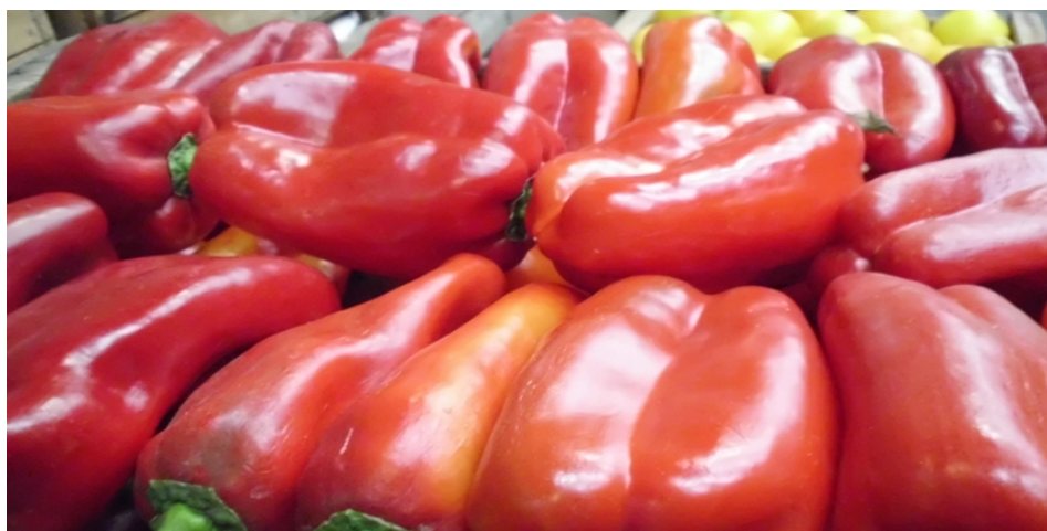
valor kilo canasta