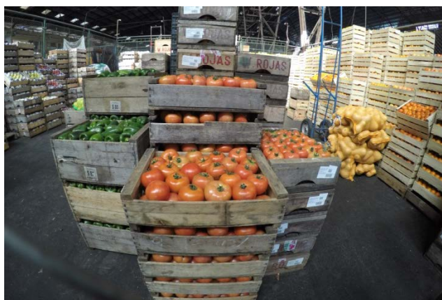
valor kilo canasta